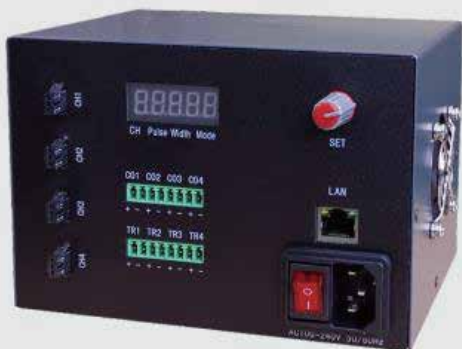
外触发频闪控制器